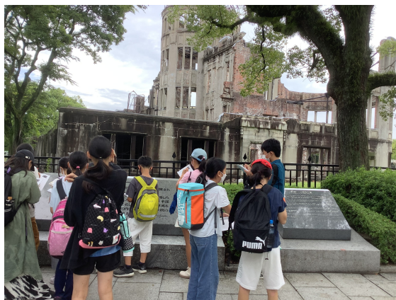
（碑めぐり：原爆ドーム前）

です。そして、その後遺症は、いつ起こるか分からないところも恐ろしいことだと思います。語り部の方もその1人で、50歳ごろ、急に腎臓や心臓、脊髄などを患ってしまいました。