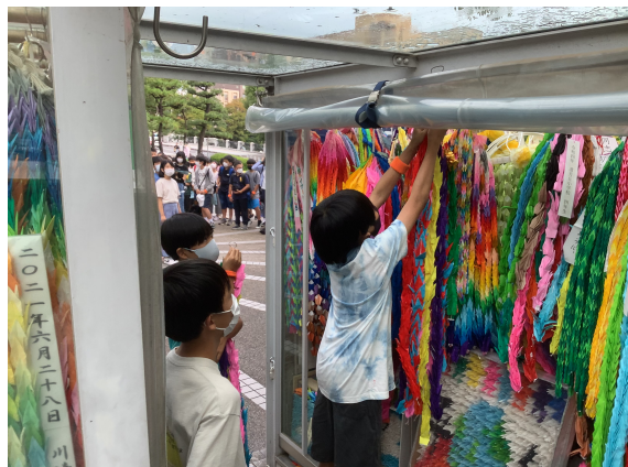
（原爆の子の像の前で平和集会を行い、折り鶴をささげました）