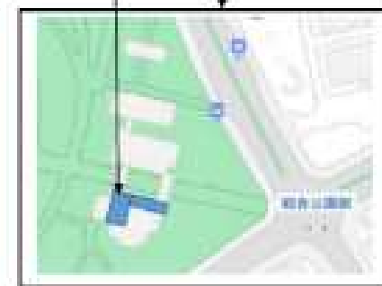
① 総合公園会議室棟エントランス