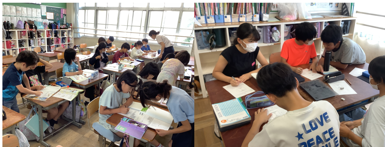
【体育でも理科の実験でも算数の授業でも聴き合い、かかわり合い、学習しています】